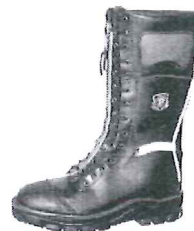
Schnürstiefel Art. 33326