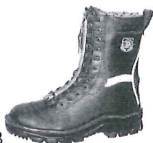
Schnürstiefel Art. 33323

4. Gegenstand der Erklärung (Identifizierung der PSA, die die Rückverfolgbarkeit ermöglicht; sie kann gegebenenfalls ein ausreichend scharfes farbiges Bild enthalten, wenn es zur Identifizierung der PSA erforderlich ist):